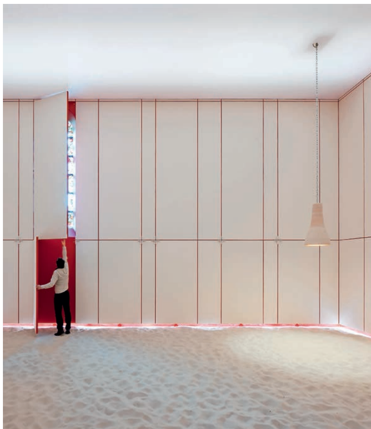
FOTO 2: Kapel Van De Ontluiting, VLP Groot-Bijgaarden (Ontwerp: tc plus)

In de 'Kapel Van De Ontluiting' (foto 2) van de Broeders Van De Christelijke Scholen in Groot-Bijgaarden is de oorspronkelijke, traditionele kapel volledig gerenoveerd en daarna is er als een tweede huid een nieuwe, witte kapel in gebouwd. Die witte ruimte dient in eerste instantie om bezoekers de kans te geven om tot verstilling te komen, dichterbij zichzelf. Het is een plek die duidelijk uitnodigt tot open dialoog vanuit diverse overtuigingen. Wie behoefte heeft om de katholieke traditie binnen dat zoeken te betrekken, kan de ruimte 'openluiken' en de verhalen van de glasramen en muurschilderingen weer inzetbaar maken. Maar er zijn evenveel lege luiken waar iets nieuw of anders kan toegevoegd worden. De ruimte is gevuld met zand waarin gemakkelijk teksten en symbolen getekend kunnen worden maar even snel ook weer uitgewist kunnen worden.