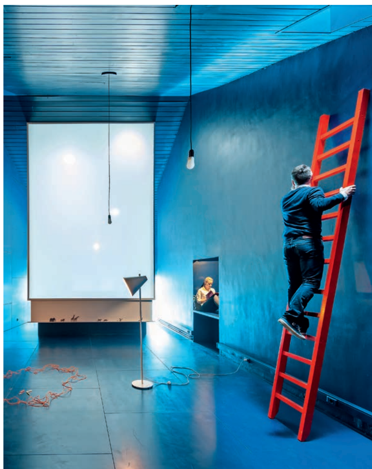
FOTO 3: Blauwe Zone, OLVA, Brugge, 2015 (Ontwerp: tc plus)

Op foto 3 zie je de Blauwe Zone, een stille ruimte voor studenten en leerkrachten in het Onze-Lieve-Vrouwecollege in Assebroek. Die ruimte is in eerste instantie een donkerblauwe, ingetogen plek om te bekomen van de drukte van de dag, om stoom af te laten. De hele kapel is in blauwe krijtverf geschilderd waardoor je er ook letterlijk alles van je af kan schrijven. Het is een ruimte die eerder plaats biedt aan de individuele beleving. Maar middenin die ruimte hangt een grote lichtkamer waar een klagroep in kan gaan. Die kamer is verticaal gericht en baadt in het licht. Ze brengt vooral ontmoeting en oplading teweeg. Op die manier kan ze bijdragen aan een reflectiemoment. Zowel het ontladen als het opladen zijn gevolgen van de stilte.