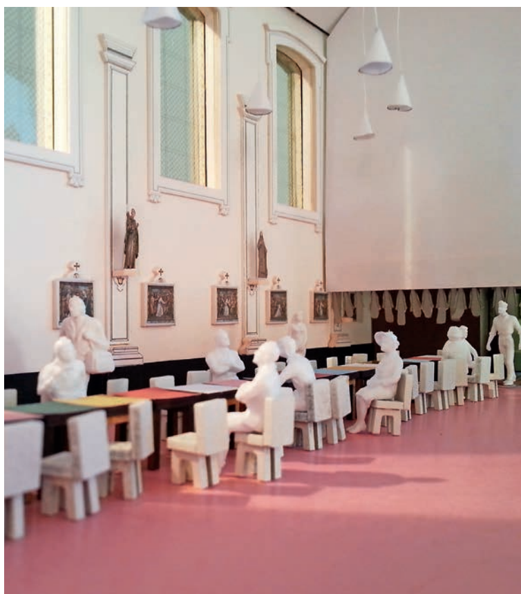
FOTO 1: identiteits- en ontmoetingsplek voor een basisschool. (Ontwerp: tc plus, maquette en fotografie: Natalie Allaert)

Op foto 1 zie je een maquette van een school die hun kapel ontwijd had en er een studie- en concertzaal van wou maken. Naast deze twee functionele eisen was de school na enkele workshops overtuigd om deze plek ook in te richten als de kernplek van hun pedagogische identiteit, de plaats bij uitstek waar ze kunnen vertellen en ervaren waarvoor het beleid en de leerkrachten staan. Een plek waar zowel ruimte is voor hun geschiedenis en traditie als voor de toekomstperspectieven. De voormalige kapel is hierdoor de geschikte ruimte geworden waar de leerlingen wezenlijke momenten samen kunnen beleven. Zo moet bijvoorbeeld bij het overlijden van een leerling niet in allerijl de turnzaal omgetoverd worden naar een stille ruimte. Of kunnen ze bij terreuralarm meer doen dan binnen gaan schuilen, maar hebben ze een plek waar zulke indringende gebeurtenissen beleefd en besproken kunnen worden.