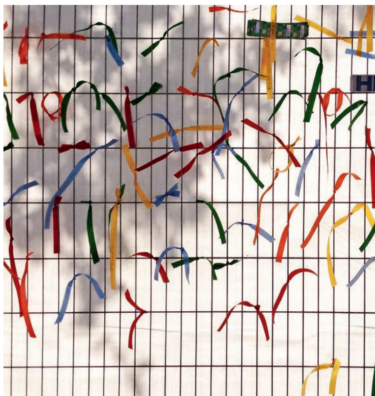
FOTO 4: Pukkelpop, Kiewit, 2012 (Ontwerp: tc plus, fotografie: Sien Wittevrongel)

Toen in 2011 in het festival Pukkelpop geteisterd werd door hevig onweer en enkele festivalgangers het leven verloren, vroeg de organisatie ons het jaar nadien om een stille ruimte (foto 4) te ontwerpen om mensen naast het feesten ook de kans te geven hun emoties van het vorige jaar te verwerken. Er is toen middenin het festivalterrein een visueel stille ruimte ontworpen die helemaal wit was: een opeenvolging van witte nadarhekkens, witte picknickbanken en tot slot ook enkele witte containers om je helemaal in terug te trekken. Er waren ook kleurrijke ribbons gelegd waar bezoekers een tekst op konden schrijven en die aan de nadarhekkens ophangen. Op het einde van het festival hadden in alle sereniteit honderden jongeren de kleurrijke bandjes opgehangen in de witte plek. Zo was de witte, stille ruimte na vier dagen een serene maar toch feestelijke en kleurrijke ruimte geworden. Dit is zowel voor de organisatie als voor de vele jongeren een helend proces geweest waarbij de ruimte ondergeschikt aan en in dienst van het ritueel had gestaan.